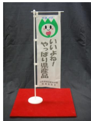
のぼり（卓上用） ミニ (W120×H350) 小 (W150×H450) ※写真は【全協力店向け】