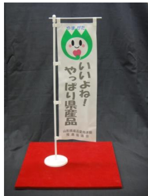
のぼり（卓上用） ミニ(W120×H350) 小(W150×H450) ※写真は【全協力店向け】